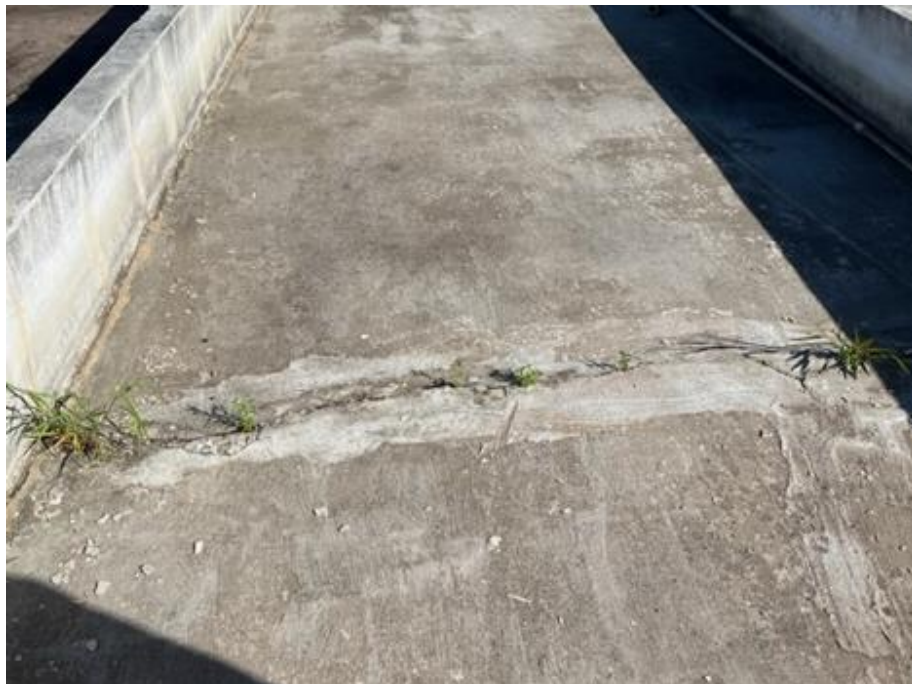
Fotografia 5 – Rachadura retilínea no fundo da camada de concreto do tanque.