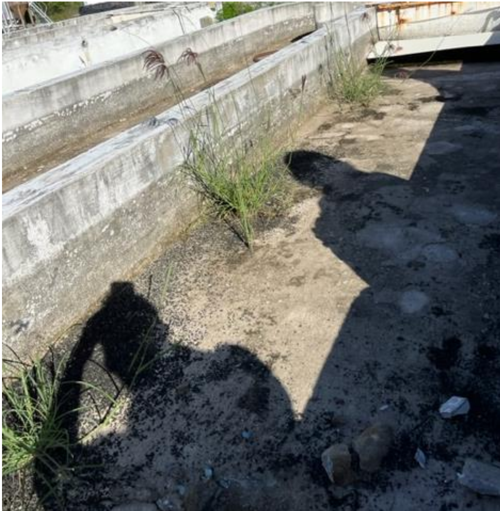
Fotografia 3 – Existência de vegetação dentro dos tanques, originando-se a partir do fundo, indicando elevada umidade.

Tais fissuras apresentaram uma configuração linear, propagando-se desde o fundo e estendendo-se até o topo das paredes, sendo típica de retração associada aos ciclos de contração e expansão das variações térmicas ao longo do dia. Também foi possível constatar a existência de muita vegetação dentro dos tanques, indicando elevado grau de umidade em contato com o fundo e paredes, principalmente do solo úmido localizado abaixo do fundo do tanque.