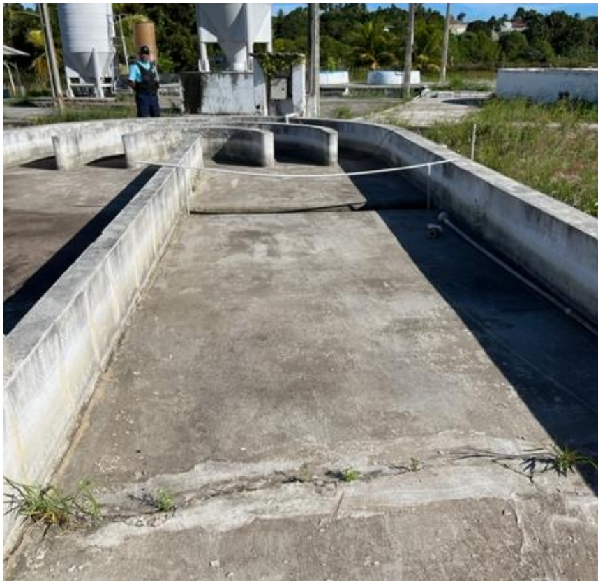
Fotografia 1 – Tanques utilizados para cultivo de microalgas.

O projeto piloto faz parte de uma colaboração entre a Empresa de Pesquisa Agropecuária do Rio Grande do Norte (Emparn), Petrobrás e a Universidade Federal do Rio Grande do Norte e fica localizado na Fazenda Samisa, no município de Extremoz/RN. O projeto tem como um dos objetivos estudar o uso e a vantagem das microalgas na produção de biocombustível comparadas a outros vegetais oleaginosos, a exemplo do girassol.