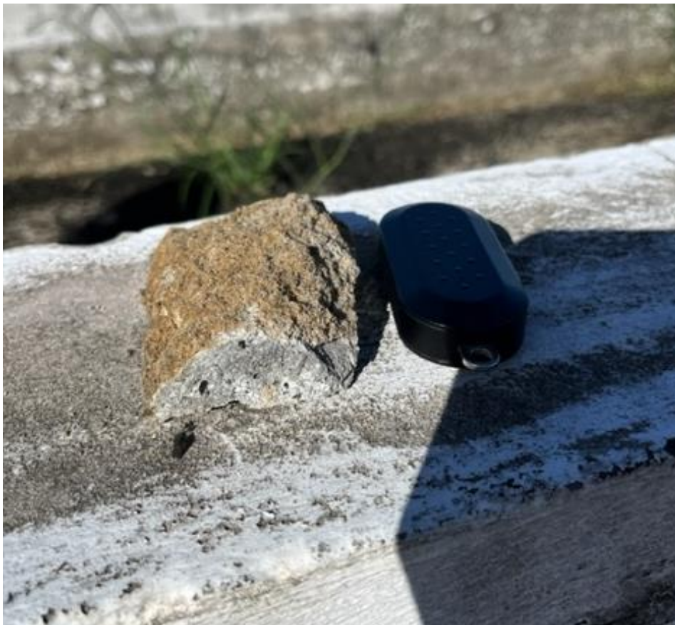
Fotografia 6 – Camada de concreto simples (Fundo) com 1 cm de espessura.

Por meio de inspeção constatamos que o fundo do tanque é de concreto simples e possui espessura muito pequena, da ordem de 1 a 2 cm, estando totalmente oco, com presença de vazios abaixo dele e descolamento do concreto, além da umidade já citada. Esta camada de fundo deverá ser totalmente substituída. Acrescentamos que não foi possível observar a existência de um sistema de impermeabilização dos tanques.