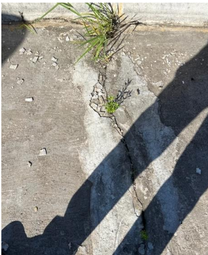
Fotografia 2 – Fissura existente em fundo de concreto do tanque.

Durante a vistoria técnica foi possível constatar diversas fissuras distribuídas nas faces internas e externas das paredes de todos os tanques, além de fissuras no fundo de concreto. Algumas destas fissuras apresentaram aberturas significativas, maiores do que os valores permitidos por normas, indicando comprometimento da estanqueidade necessária.