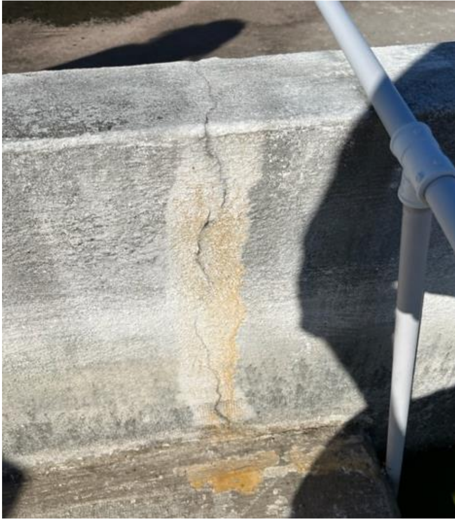
Fotografia 4 – Fissura retilínea de retração em face interna da parede do tanque.