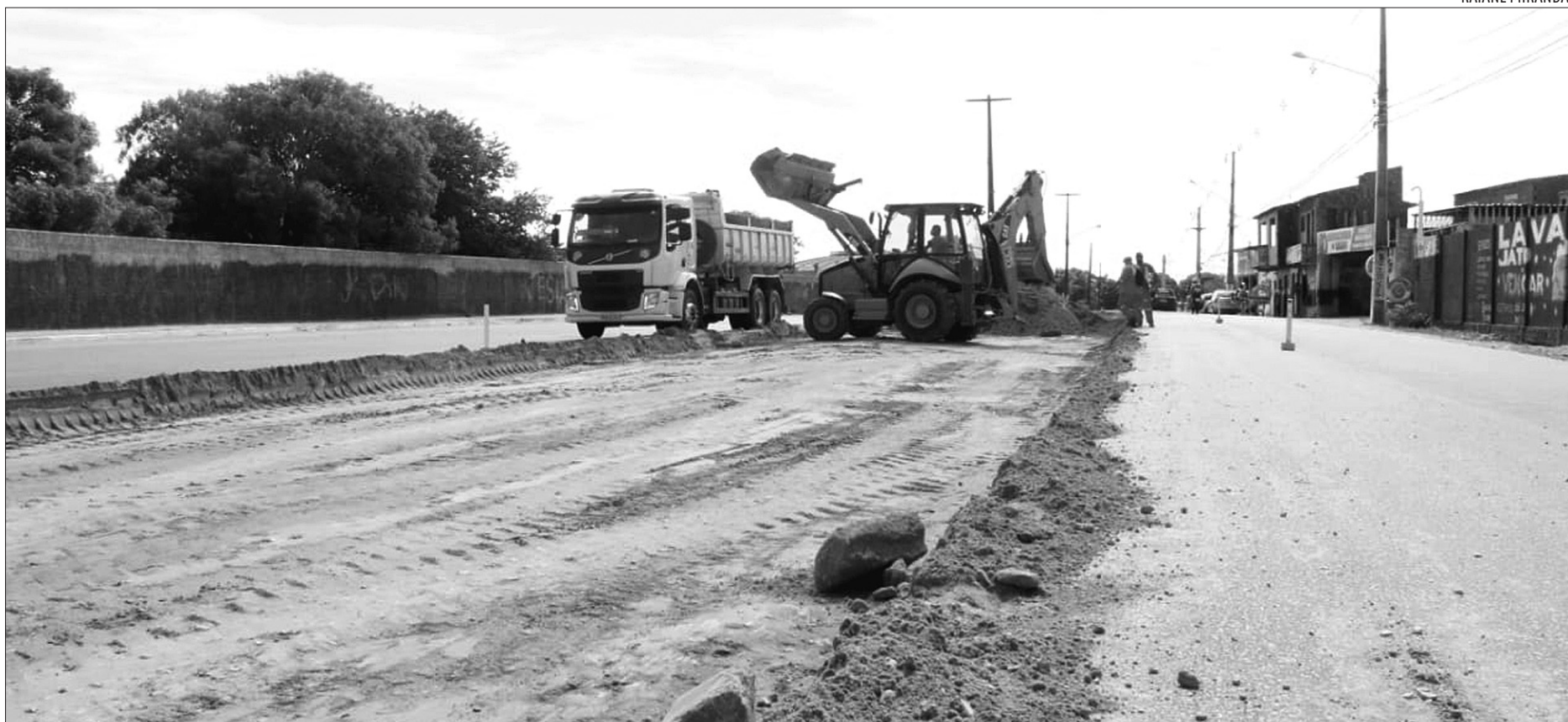
Obras do Pró-transporte foram retomadas após a modificação da forma do financiamento. Um dos trechos depende de recursos para desapropriações

As obras do Pró-Transporte se arrastam desde o ano de 2005. Em 2019, o Governo teve de encerrar o contrato com a construtora que executou parte da obra para lançar uma nova licitação. Graças ao novo processo, o Executivo foi capaz de inverter a porcentagem de contrapartida que até então era dada pelo Estado, que passou a representar cerca de 28% do valor total da obra. "Antes, havia uma inversão: a parte financiada pela Caixa era a menor, e conseguimos fazer isso para facilitar a continuidade da o-